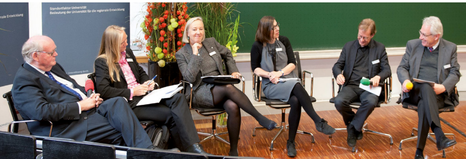
Kanzlerjahrestagung 2014 in Ulm: Podiumsdiskussion zum Thema „Standortfaktor Universität“